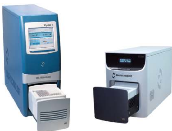
Рис. 1. Приборы производства компании «ДНК-Технология»

приборы серии ДТ производства ООО «НПО ДНК-Технология» (ДТлайт, ДТпрайм, ДТ-96) (рис. 1).